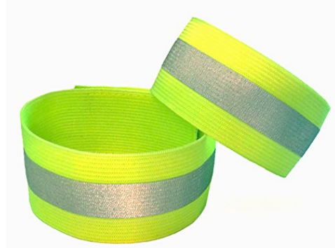
Example of ankle band meeting retroreflective standard