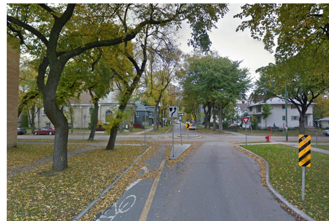
Piste cyclable avec zone tampon